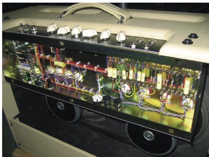
Entrañas de la cualitativa circuitería de los amplis George, construida de forma artesanal bajo la técnica del cableado a mano y punto a punto

La versión algo más potente de El Dorado. En realidad es prácticamente igual, pero con algunas mejoras y sobre todo con una etapa de potencia más contundente. Este que hemos probado presenta un blanco imaculado, pero, al igual que el resto de equipos George, puedes customizártelo con 10 acabados diferentes y en colores que raramente vas a encontrar en otros amplis de boutique. Se trata de un combo de 1x12" de 30 vatios a válvulas Clase A de potencia media y, al igual que su hermano, de muy alta gama. También está realizado totalmente a mano de forma artesanal, utilizando la técnica del cableado a mano y punto a punto. Como El Dorado, su altavoz de serie es un Celestion Vintage 30, aunque bajo pedido lo pueden entregar también con un Celestion Gold Alnico. Una de sus principales características es que cuenta con dos canales y 4 entradas (2 para cada uno, una de baja y otra de alta impedancia, según queramos tocar más opaco o brillante). El canal 1 lleva una TAD ECC83 como primera válvula del previo, mientras