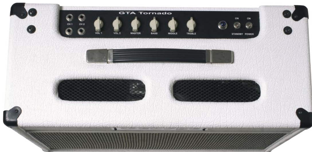
Cuadro de mandos del Tornado One de 30 vatios, compuesto por 4 entradas, 2 volúmenes independientes, graves, medios, agudos y master.

Una de las mayores obsesiones de Jorge Bueno y su equipo era dar con un sonido único rico en matices,