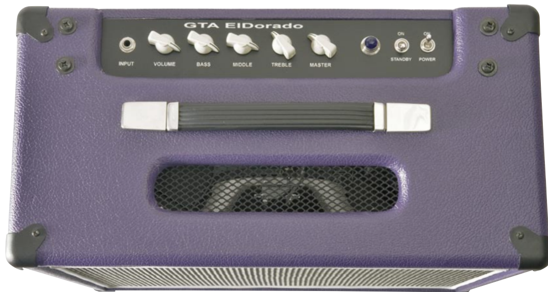
Panel frontal de El Dorado, con su original acabado custom en morado y su estética vintage, que deja a la vista el altavoz Celestion Vintage 30 que incorpora

PRECIO: 1600 € ORIGEN: España AMPLIFICADOR DE POTENCIA: 30 vatios a válvulas Clase A ALTAVOZ: 1 Celestion Vintage 30 de 12" VÁLVULAS DE PREVIO: 1 TAD EF86 y 3 TAD ECC83-Cz VÁLVULAS DE POTENCIA: 4 TAD EL84-STR VÁLVULA RECTIFICADORA: 1 TAD GZ34 SELECTOR DE IMPEDANCIAS: 4, 8 y 16 Ohmios ENTRADAS: 4 CANALES: 2 CONTROLES: Volumen 1, volumen 2, graves, medios, agudos y master EFECTOS: No MEDIDAS: 61,5 x 47 x 25,5cm PEDALERA: No